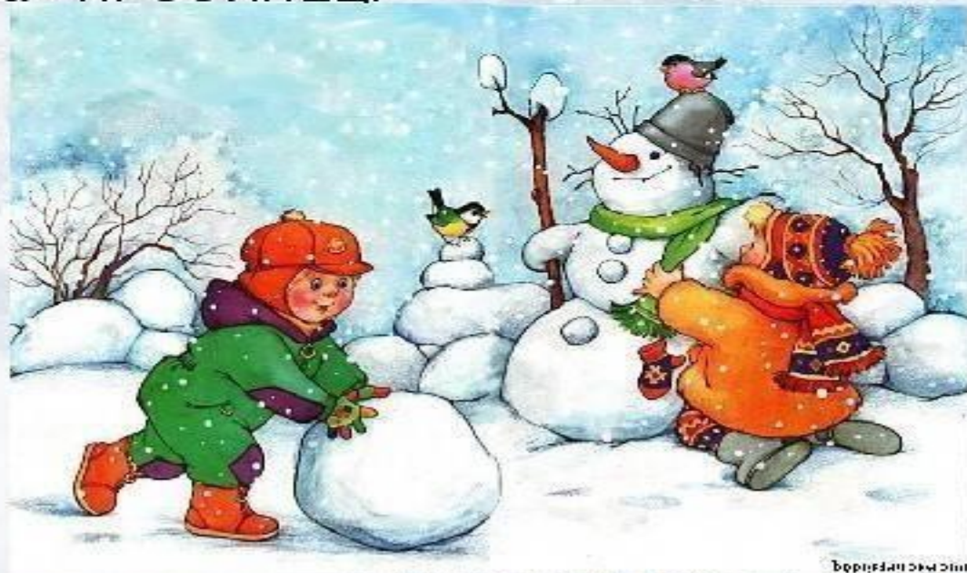
Иллюстрация: В. Смирнов